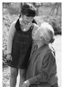
予防を心がけて 楽しい毎日!

介護保険のショートステイや入院により在宅を離れた期間が100日以内 申請期限 12月16日(金) 給付額 8万円 申請先・問合せ 福祉課高齢福祉係 ■内線191