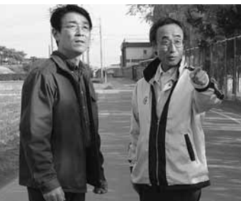
要注意箇所 板高北側道路付近