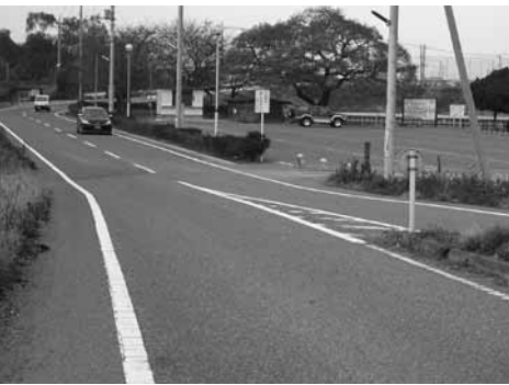
要注意箇所 群馬の水郷入口付近