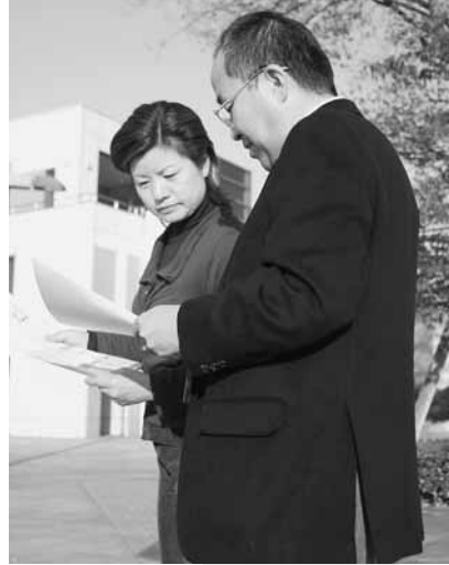
要注意箇所 板倉東洋大前駅周辺