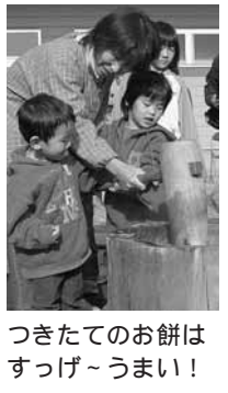
はがきのお餅は うまい～ つけたての餅は すっげーうまい!

餅つきやしめ縄作りを行うおもしろい農業体験を開催します。親子やお友達と、おいしく楽しく農業を体験してみませんか?