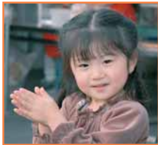
健康の郷「季楽里」感謝祭