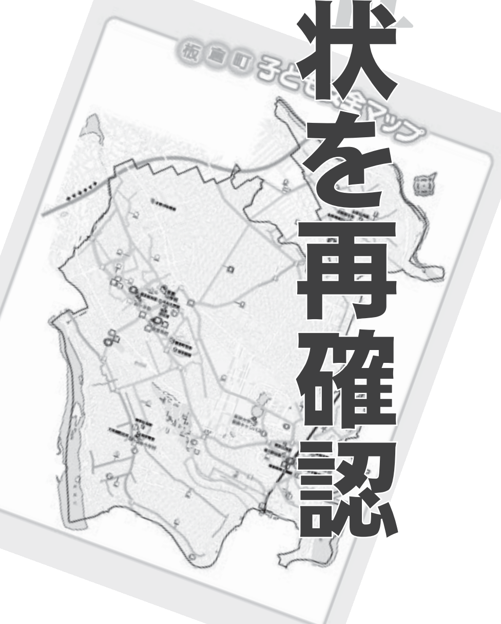
要注意箇所 二本木付近

歩いて気がついた現状 広報編集委員は、子ども安全マップの記された現場を実際に歩いて確認。現状を検証して、町内にこんなにもたくさん危険な箇所があるのかと驚かされました。