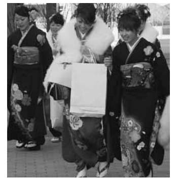
みんなで祝おう！ 20歳の門出

食の伝承士養成講座 参加者募集 水郷のまちに伝わる郷土料 理を作って、食の民俗文化伝 承士になってみませんか。 この養成講座は、旬の食材 を使って作る郷土料理のおい しさ、栄養価の高さなどを再 確認し、それぞれの家庭の作 り方や味を伝えます。 今回は、東毛の粉食文化の 筆頭、うどん(ひもかわ)作 りにチャレンジします。ぜひ、 ご参加ください。 日時 12月27日(火) 午後6時 会場 中央公民館 講師 ミヤツセクラブ 参加費 無料 募集人員 20名 内容 ひもかわのうちはいれ 申込先 問合せ 文化財保護係 ☎内線157