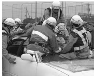
防火意識を高めます 消防秋季点検

11月6日(日)、板倉中学校校庭で館林地区消防組合消防隊による秋季点検が行われました。