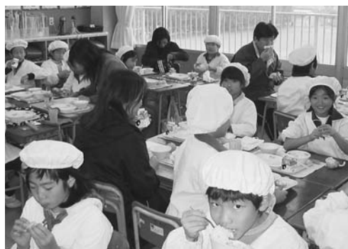
オープンスクールでの親子給食会

学校給食の役割、献立、調理法の説明から子どもたちに人気のある献立メニュー、栄養バランスの良い調理法の指導も行っています。