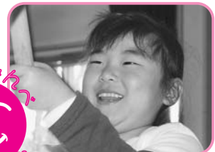
新年のつどい(西保)