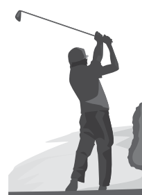
やめよう！ 運動場でのゴルフ

みなんで使う場所だから、運動場施設の使用のお願い。グラウンドや体育館はみんなです。気持ちよく使おう。利用されるのかたは、以下の注意事項を守りましょう。 グラウンド使用上の注意 使用後はきちんとブラシヤトンをかけ整備しましょう たばこの吸いがら、ゴミ、空き缶は必ず持ち帰りましょう グラウンド内でのゴルフ禁止 体育館使用上の注意 使用後はきちんとモップをかけた清掃をしましょう たばこの吸いがら、ゴミ、空き缶は必ず持ち帰りましょう 故意に壁にボールをぶつけるなど施設を傷つけるような行為はやめましょう