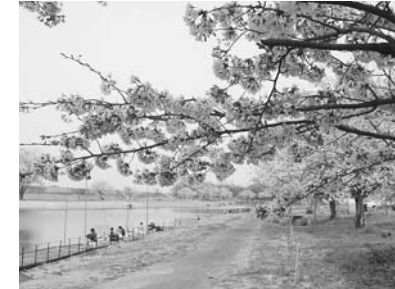
自然を生かした水辺公園 群馬の水郷公園