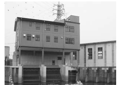
排水管理で洪水被害を防ぐ 邑楽東部第1排水機場