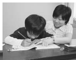
子どもたちの自主学習をサポート！