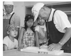
いろいろな体験教室が開催されます！