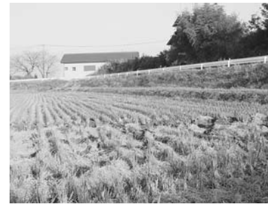
文化的景観の一つ 海老瀬の自然堤防