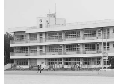
耐震補強が予定される 東小学校舎

平成19～21年度の一般会計予算総額の計画額は下表のとおりです。平成21年度予算額は、本年度比較で、1億4,119万円の減額を計画しています。