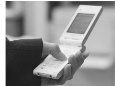
災害情報などを提供！ 安全安心メール