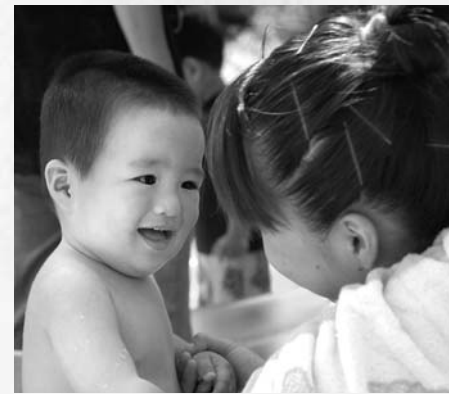
9月3日のお楽しみは、みんなでプール。水遊びはとっても楽しいよ