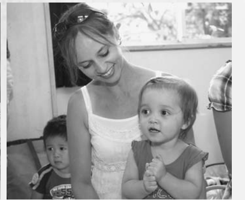
まずは、自己紹介をします。みんなで輪になってリズムを取りながらごあいさつ