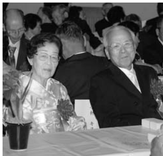
平成19年度合同祝賀会にて

町では、金婚式・ダイヤモンド婚式を迎えるご夫婦をお祝いします。次に該当するかたは、期限内に忘れずに申請してください。