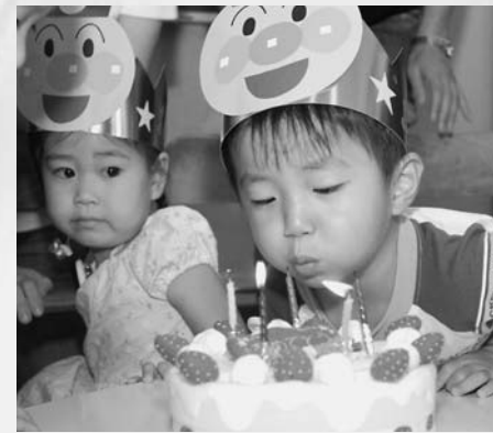
毎月行われるお誕生日会。ローソクを元気に消した後は、お母さんと写真撮影