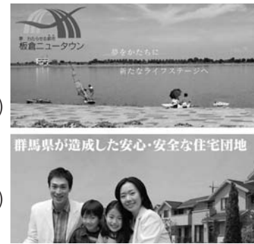
群馬県が造成した安心・安全な住宅団地

10月11日(土)から19日(日)まで 秋の分譲キャンペーンを実施 します。 所在地 朝日野4丁目 分譲区画 23区(複数申し込 みの場合は抽選) 面積 210.88㎡ 272.87㎡ 分譲価格 750万円台、 1,080万円台 申込期間 10月17日(金)~10月 19日(日)の正午 抽選会 10月19日(日)午後2時 ご成約プレゼント 板倉産コ シヒカリ一俵 申込方法 所定の用紙に記入 し、板倉ニュータウン販売セ ンターまで