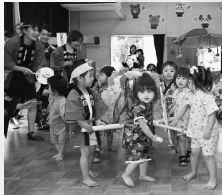
7月に行われた夏まつり。手作りの御神輿も登場、盛り上がりました