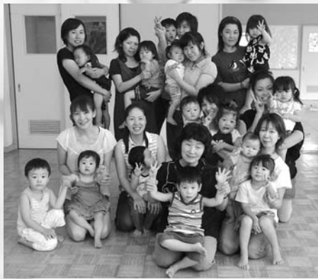
ひまわりキッズ役員の皆さん。いろいろなイベントの準備に大忙しです

滑油となってくれます。まずは、一度遊びに来てください。地域、家族、子どものことなど、みんな少なからず悩みを持っています。ここにきて、アドバイスをもらったり、愚痴を言い合ったりしてストレスを吐き出して欲しい。逃げ場があることを知って欲しい。ひとりじゃないんです。ひとりきりじゃ子育てできませんから」 今後は他のサークルとのネットワーク作りや合同イベントなどができればと、抱負も語ってくれました。これから、ますます楽しく、にぎやかになりそうです。