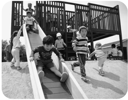
お庭には、オリジナルの遊具が並びます。子どもたちは皆楽しく安全に遊びます。