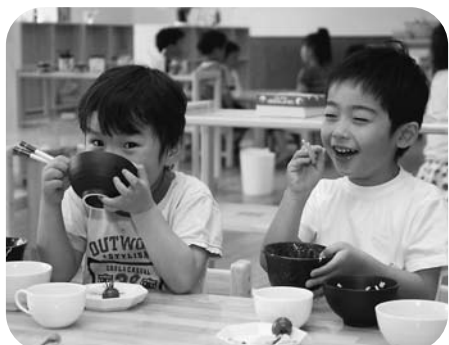
大好物をいっぱい食べられるバイキング、でも、嫌いなものにもチャレンジします。

自主性や個性を伸ばす保育 保育園に通う子どもたちは、「0歳児から学童保育まで含め、総勢143名、19名のスタッフによりシフト制で午前7時から午後7時の延長保育まで対応しています。シフト制にした理由は、保育士が疲れていては良い保育サービスが提供できないとのこと。保育士の労働管理にも注