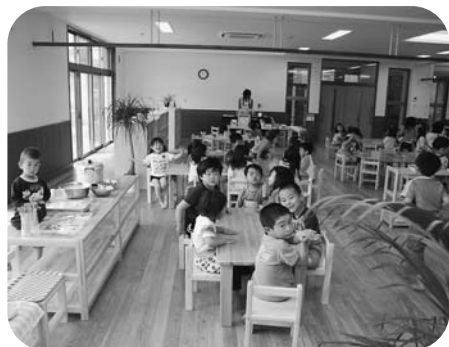
もう、お腹ペコペコ、そろそろお昼、バイキング形式での給食が始まります。