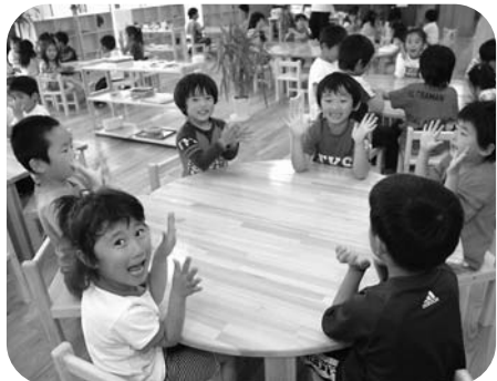
保育室は各コーナーごとに遊具がそろい、好きなときに好きな遊具で遊びます。