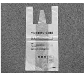
10月からラップ系ごみ袋を10枚100円で販売しています。町指定取扱店で購入できます。