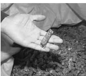
燃えるごみをラップ系ごみと分別により、塩素分の少ないRDFが完成し、資源となります。