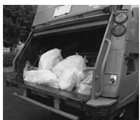
収集車は、ラップ系ごみを車内に巻き込まず、燃えるごみと分別して、運搬します。