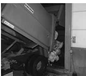
燃えるごみは、RDF施設に投入され、成形行程を経てRDFができあがります。