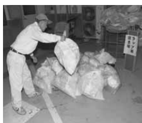
ラップ系ごみは、RDF施設に投入せず、委託業者により焼却処理をしています。