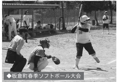
◆板倉町春季ソフトボール大会