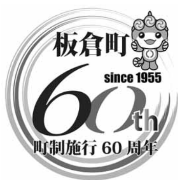
↑町制施行60周年記念のロゴマーク

募集要項、承認申込書は、町ホームページ及び総務課秘 問合せ 秘書人事係 ☎内線111