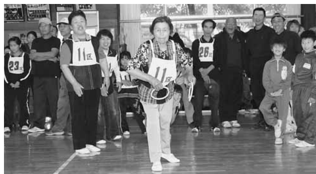
↑雨天によりグラウンドゴルフの代わりに輪投げに競技が変更

この日植えた苗は10月に稲刈りを予定していて、11月に行われるマラソン大会で赤飯にして食べる予定です。