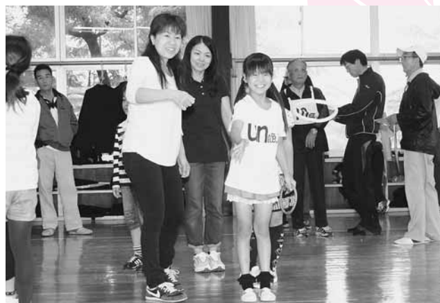
↑輪の投げかたを教わりながら輪投げを楽しみました