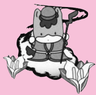
おぜのかみさま ぐんまちゃん