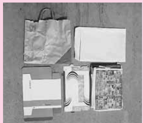
包装紙・紙袋・紙箱・封筒・チラシ・コピー用紙など紙全般

家庭から出される古紙のうち、新聞・雑誌・段ボール・飲料用パックのいずれにも入らないものを雑がみといいます。雑がみも他の古紙と同様に製紙原料となる大切な資源です。リサイクルの促進と可燃ごみの減量化のため、ご家庭で雑がみを集めて、資源化センターへお持ちください。雑がみの例 持ち込む際の留意点 金属やプラスチックが付着しているものは取り除く。はがきや封筒に貼られたシールは取り除く。 雑がみに混ぜてはいけないもの 粘着物のついた封筒、圧着はがき、金・銀などの金属が箔押しされた紙(ジュースのパックなど)、防水加工された紙(紙コップなど)・水に濡れた紙、油のついた紙など。 問合せ 資源化センター ☎8215371