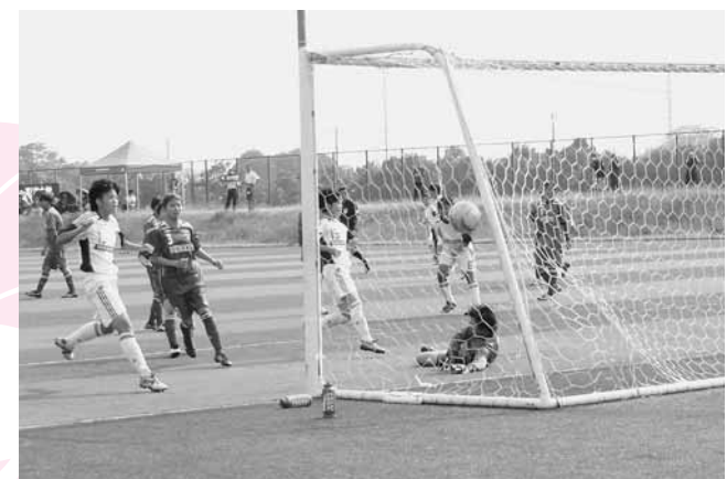
↓左サイドからのシュートがサイドネットにつきさりました