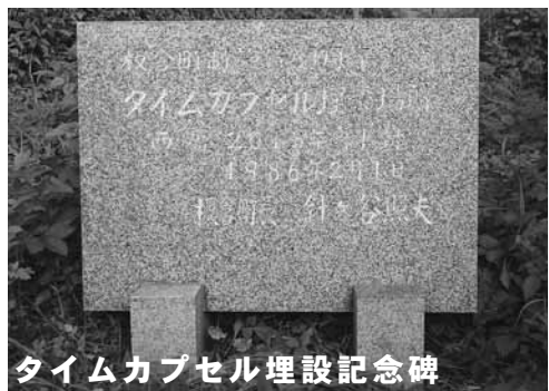
タイムカプセル埋設記念碑

昭和61年2月5日、町制施行30周年記念事業の一つとして、中央公民館西側緑化帯に埋設されたタイムカプセルの掘り起こし及び開封式を実施します。このタイムカプセルには、当時、各小中学校の児童生徒や町内から応募のあった「町民による未来へのメッセージ」などが入れられています。30年の眠りから目覚めるタイムカプセルの開封に立