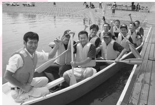
↑地元の板倉消防団の皆さんも出場しました

今年は加須市から出場した「INO-G」が2分37秒41の好タイムで見事優勝を果たしました。準優勝は「オレンジドラゴン」、3位は「T-STYLE」でした。