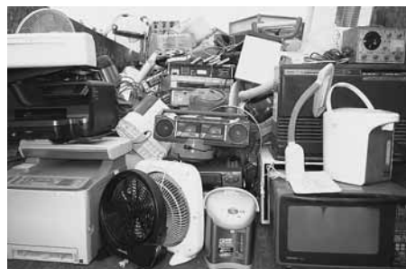
↑資源化センターに持ち込める小型家電