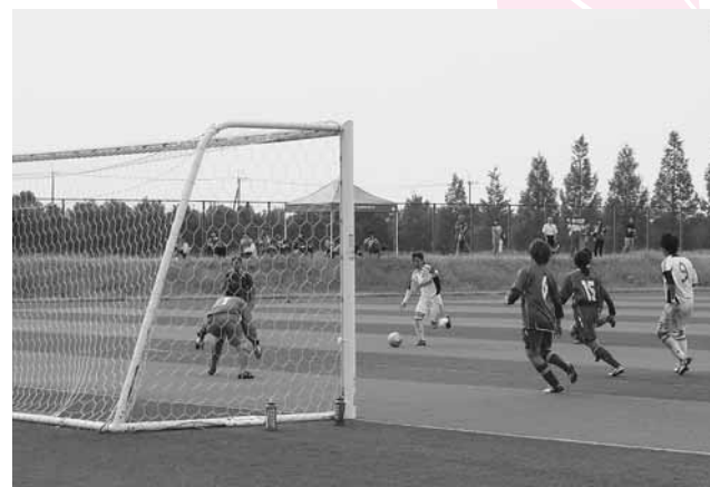
↑相手のキーパーをよく見て、落ち着いてゴールを決めました