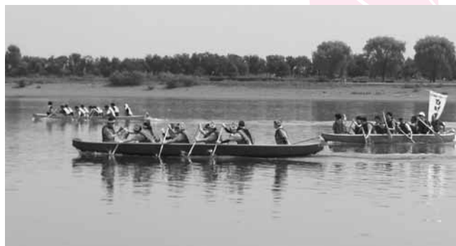
↑接戦となった見応えのあるレースも繰り広げられました