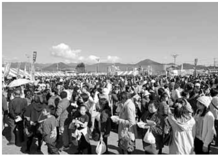
↑8万人が来場した前回の様子

○満65歳以上の高齢者のみの世帯 ○要介護3以上の認定を受けているかたのいる世帯 ○中学3年生以下の児童を養育しているひとり親(母子・父子)世帯 ※ただし、対象となる子の親が世帯主であること ○左記の障害者手帳をお持ちのかたがいる世帯 ・身体障害者手帳1・2級 ・療育手帳A ・精神保健福祉手帳1・2級 ○特別な事情により民生委員が特に必要と認めた世帯 申請方法 条件を満たしており、配分を希望するかたは、「配分金受給申請書」を板倉町社会福祉協議会、役場福祉課または地区民生委員へ提出してください。 なお、申請書は、各提出場所または民生委員のところに用意してあります。 受付期間 11月4日(火)～25日(火)(土日・祝日は除く) 午前9時～午後5時 問合せ ○社会福祉係 内線311 ○板倉町社会福祉協議会 82-3900