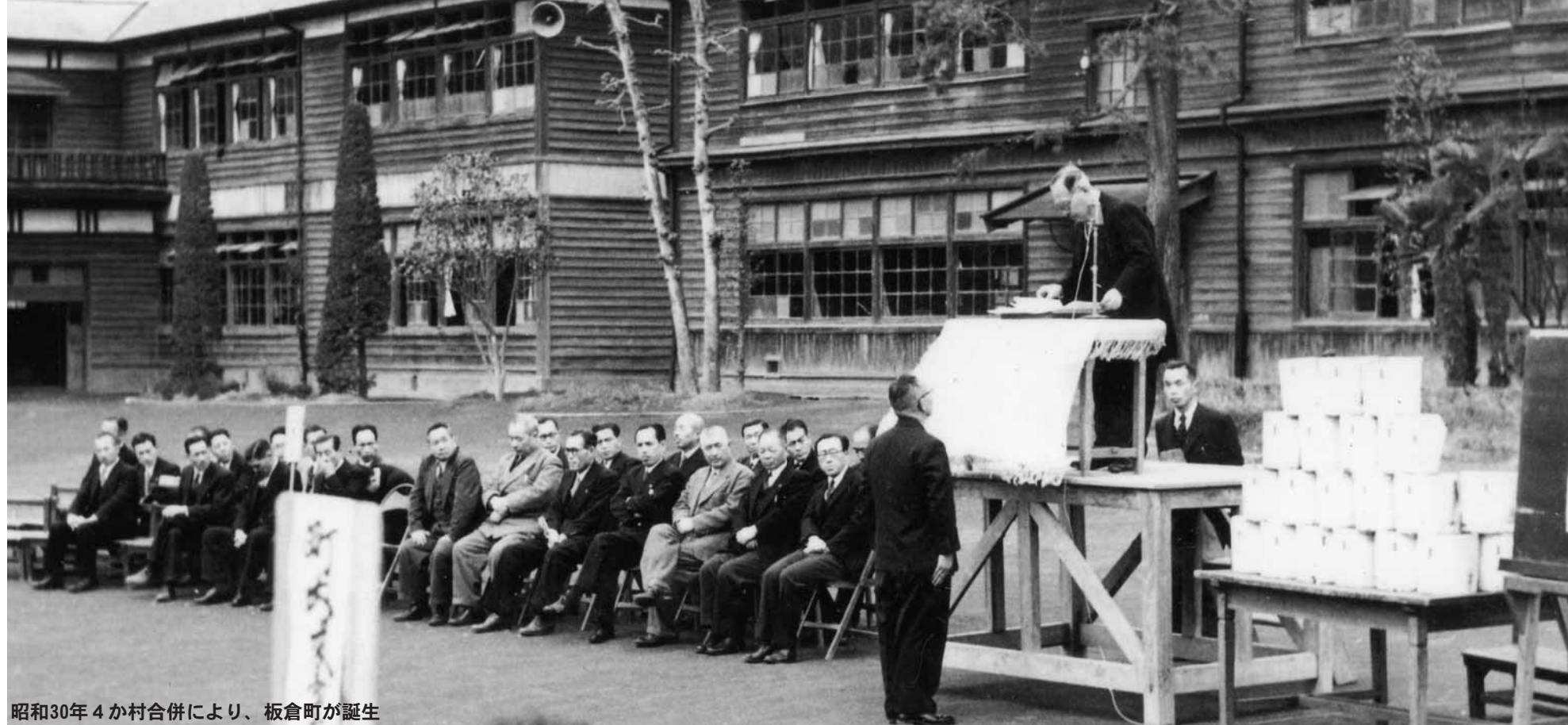
昭和30年4か村合併により、板倉町が誕生

昭和30年2月1日に昭和の大合併により、伊奈良村・海老瀬村・西谷田村・大箇野村の4か村が合併し、群馬県下18番目の町として誕生した板倉町は、平成27年2月1日、この「還曆」である町制施行60周年を迎えます。町では、平成26年8月1日から平成27年7月31日までの期間を、「町制施行60周年記念事業の実施期間」とし、「特別事業」を実施するとともに、各種団体等が実施する事業を「冠事業」とさせていただき、記念すべき年を皆様とともに盛り上げていきます。