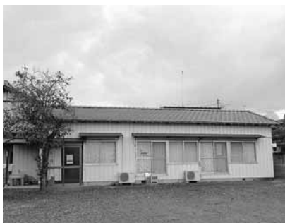
↓屋根を改修した第19区区民会館

(公財)群馬県市町村振興協会が市町村振興宝くじ(サマージャンボ宝くじ)の交付金を財源として地域コミュニティ活動に必要な施設整備を支援する「魅力あるコミュニティ助成事業」を活用して、第19区区民会館の屋根を改修しました。全国で発売される宝くじの収益金の一部は、こうした地域の健全な発展のために使われています。