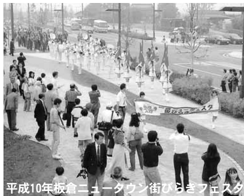
平成10年板倉ニュータウン街びらきフェスタ