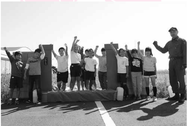
↑万が一のときには水のうを使って家に水が入るのを防ぎます

10月29日(水)、西小学校4年生を対象に川の川水防センターで水防学校が開催されました。児童たちは、利根川上流河川事務所と板倉消防署の協力で、日本の川の特徴や利根川の歴史などを学びました。また、降雨体験車による降雨体験やビニール袋に水を入れて「土のう」の代わりとする「水のう」を使って、簡易水防工法のやり方を学びました。