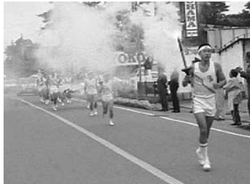
昭和58年あかぎ国体大会旗・炬火リレー