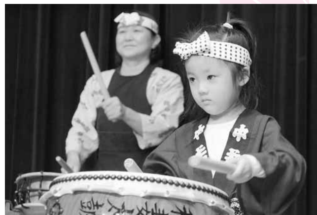
↑稲妻太鼓愛好会の新人さんは、この日初舞台を踏みました