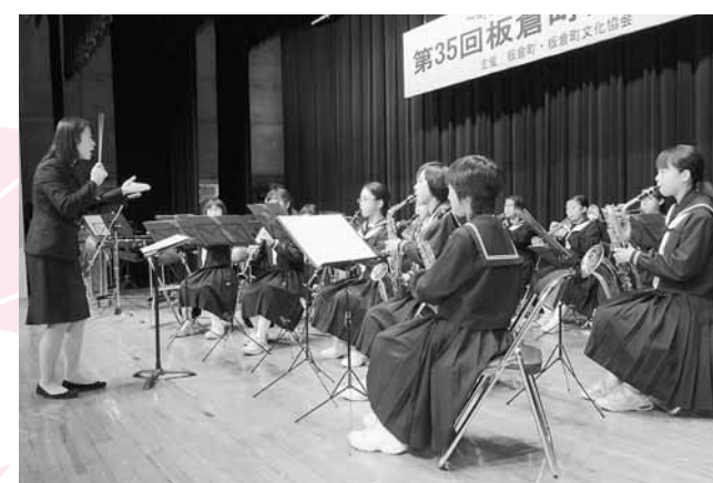
↓文化祭のオープニングを飾った板倉中学校バンド部