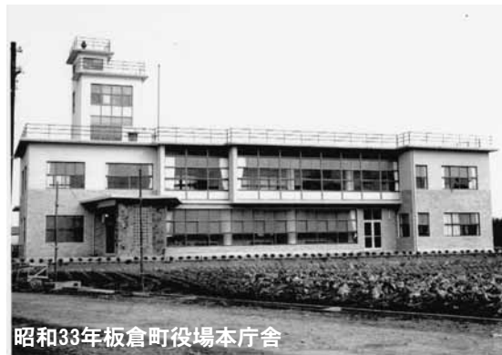
昭和33年板倉町役場本庁舎