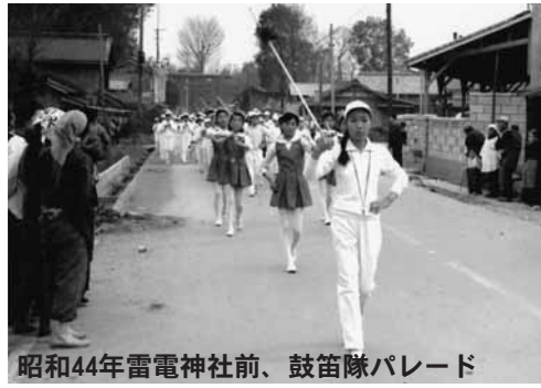
昭和44年雷電神社前、鼓笛隊パレード