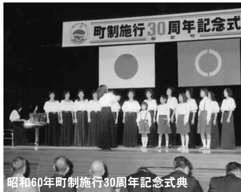
昭和60年町制施行30周年記念式典