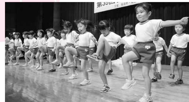
↑特別出演の板倉保育園の園児たちはフォークダンスを披露