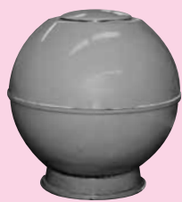
タイムカプセル封印式

町制施行60周年記念事業として、20年後の未来へ向けたメッセージをタイムカプセルに封印し、次世代につなげます。 期日 平成27年2月1日(日) 場所 中央公民館