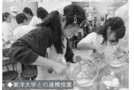
◆東洋大学との連携授業