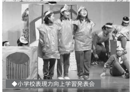
◆小学校表現力向上学習発表会