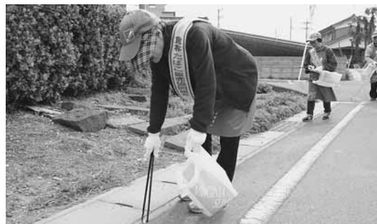
↑町内のたばこ販売組合による道路の吸い殻清掃

1箱（430円の商品）買うと105・24円が町の収入となり、平成24年度決算で約8,000万円の税収を上げています。町にとっては、大変貴重な財源となっております。たばこを購入する際は、ぜひ町内でご購入ください。