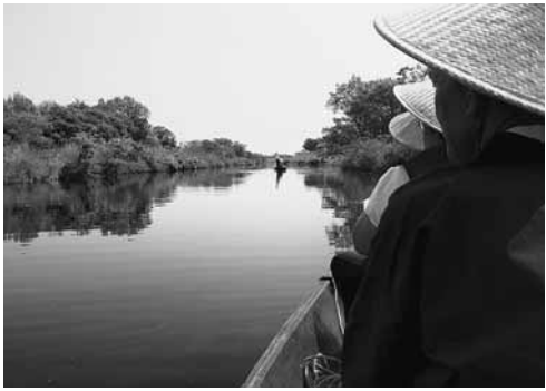
春の揚舟谷田川めぐり

春の揚舟谷田川めぐりを実施します。船頭が一本の竹ざおを使い、揚舟を鮮やかに操船しながら谷田川を周遊します。揚舟の上から心休まる景色をお楽しみください。