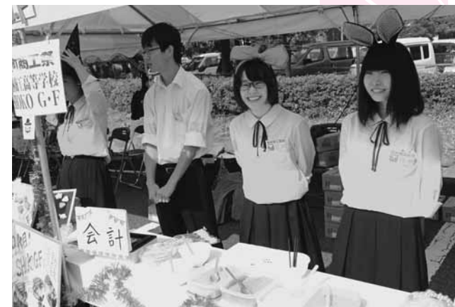
⑧ 商工祭では館林商工高校の生徒がお菓子を販売