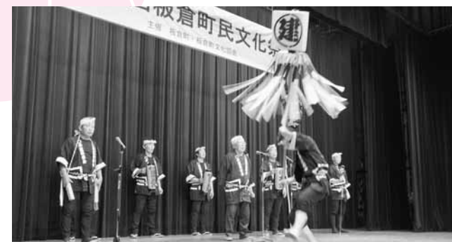
⑨ 木造保存会が仕事唄にあわせて纏(まとい)振りを披露