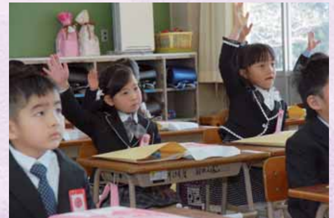
↑子ども達の健やかな成長のため教育環境の改善を進めます

試行錯誤の上、行政で出発した婚活事業も今は移行期にあると思つています。最初は全て町が関与してきましたが、現在は商工会青年部を中心とした婚活事業を展開しており、商工会青年部に決定権を持つてもらっていると思つています。今後も町として、いろいろな提言をいただき、引き続き町も協力していきたいと考えています。