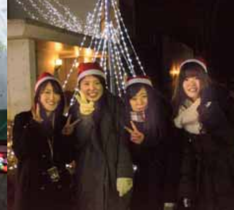
↑ 今年度実行委員を務めた皆さん