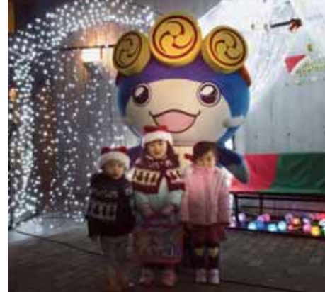
↑ 「いたくらん」が大好きな子どもたち