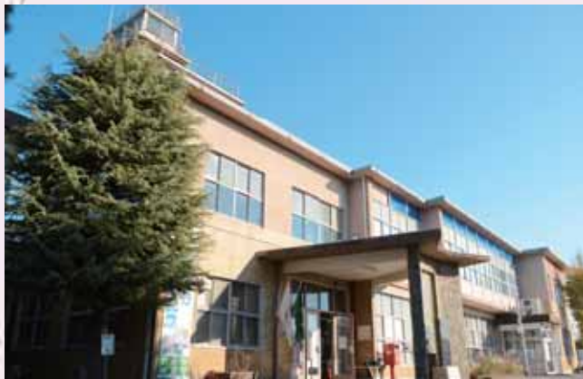
↑昭和33年に完成した役場本庁舎は経年のため劣化がみられる

現在は、全国学力テストに参加した全校のデータを集計した結果が出ています。以前、群馬県は全国で中間ぐらいの位置でしたが、現在は下位の方になっているのが事実