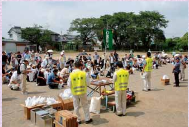
↑避難訓練に参加することで防災意識を高めましょう

防災意識を高めるには、さまざまな形を想定して、ハードルを上げながら毎年避難訓練を繰り返し実施していくしかないと考えています。