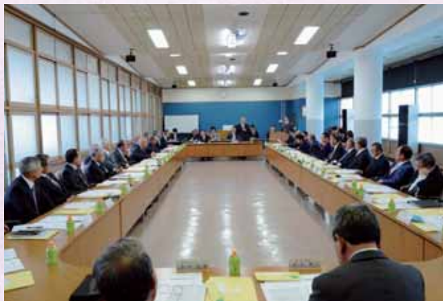
↑行政区長会議では行政区再編についても話し合われています

板倉町では小規模特認校制度を取り入れています。これは、どの小学校でもいうことではなく、少人数の南