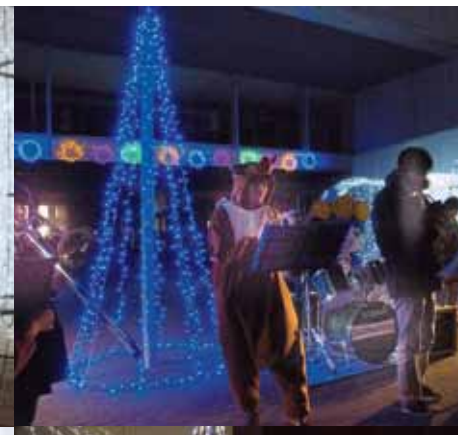
↓ 点灯式に合わせて行われたジャズの演奏