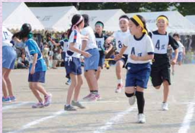
↑町民体育祭では人数が少なくて参加できない種目もあります