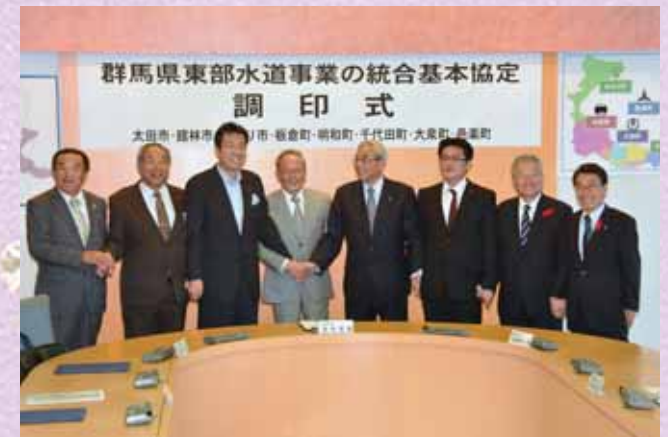
↑水道事業は3市5町での事業展開を平成28年度から行います