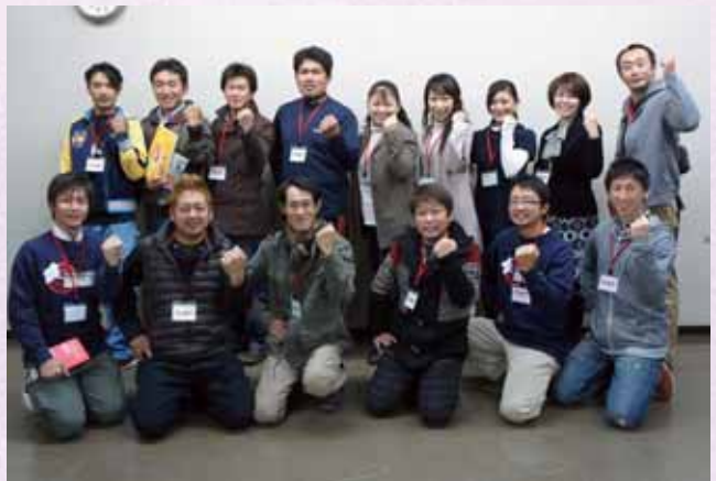
↑町の婚活を応援してくださっているボランティアの皆さん