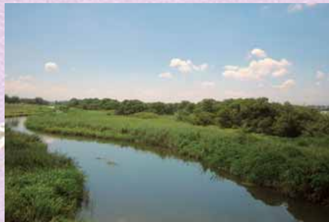
↑重要文化的景観の構成要素となる谷田川とヤナギ山の景観