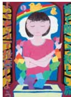
↑佐瀬優佳さんの作品