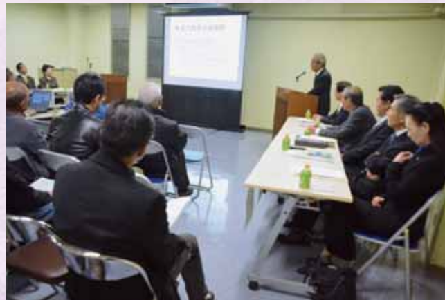
↑議会では、平成26年11月に初めて議会報告会を実施しました