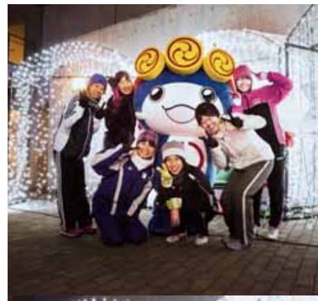
↓ 陸上競技部女子長距離部門の皆さん