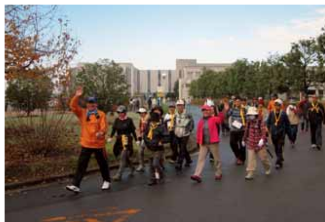
↓ 笑顔で東洋大学板倉キャンパスを出発する参加者の皆さん