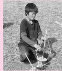
火起こしできるかな?

期間 3月28日(土)～29日(日) 場所 板倉町内(場所は当日まで非公開) 対象者 小学4年生～中学3年生 参加費 1,000円(食料費・保険代など) ※参加費は当日徴収します。 申込期限 3月9日(月)まで ※申込者には後日詳細を連絡します。 申込先・問合せ 生涯学習係 届内線 623