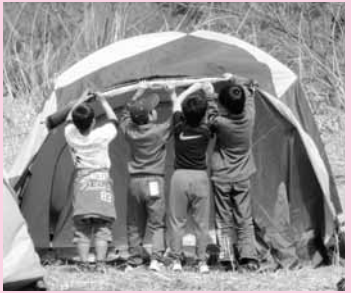
協力してテント設営