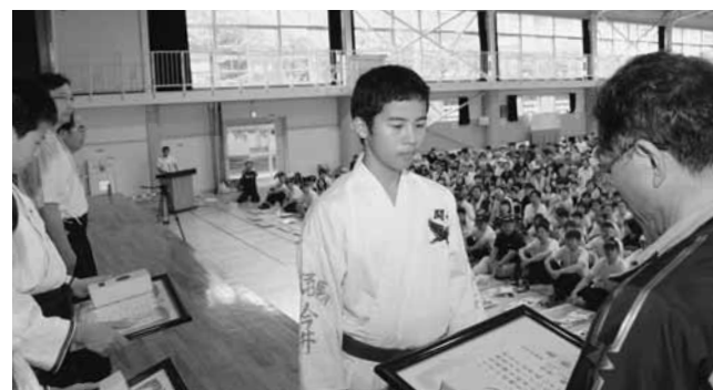
↓開会式前に教育長より体育功績者へ表彰状が手渡されました