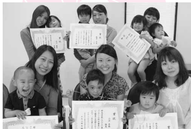
↑親子と子のよい歯のコンクールで受賞した6組の親子の皆さん

5月28日(木)、群馬県親子と子のよい歯のコンクール地区審査表彰式が開催され、1市5町をあわせ1,385名の親子のうち、町を代表して6組の親子が表彰を受けました。歯や歯ぐきの健康は、「食べる」ことだけでなく、全身の健康の原点ともいわれる大切なものです。80歳になっても20本以上自分の歯を保ち、健康で快適に過ごせるよう定期的に歯の健診をうけましょう。