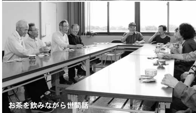
お茶を飲みながら世間話