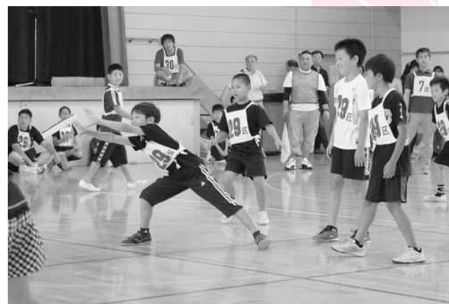
↑投げられたフライングディスクをよく見てキャッチしました