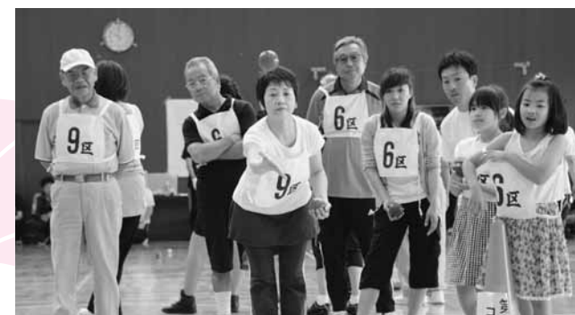
↓ニチレクボールは幅広い世代の参加者で得点が競われました