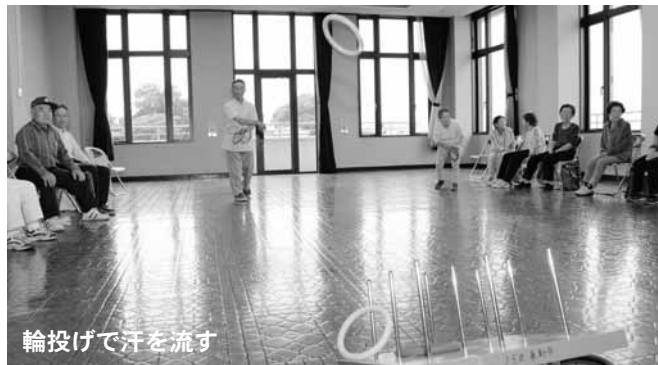
輪投げで汗を流す