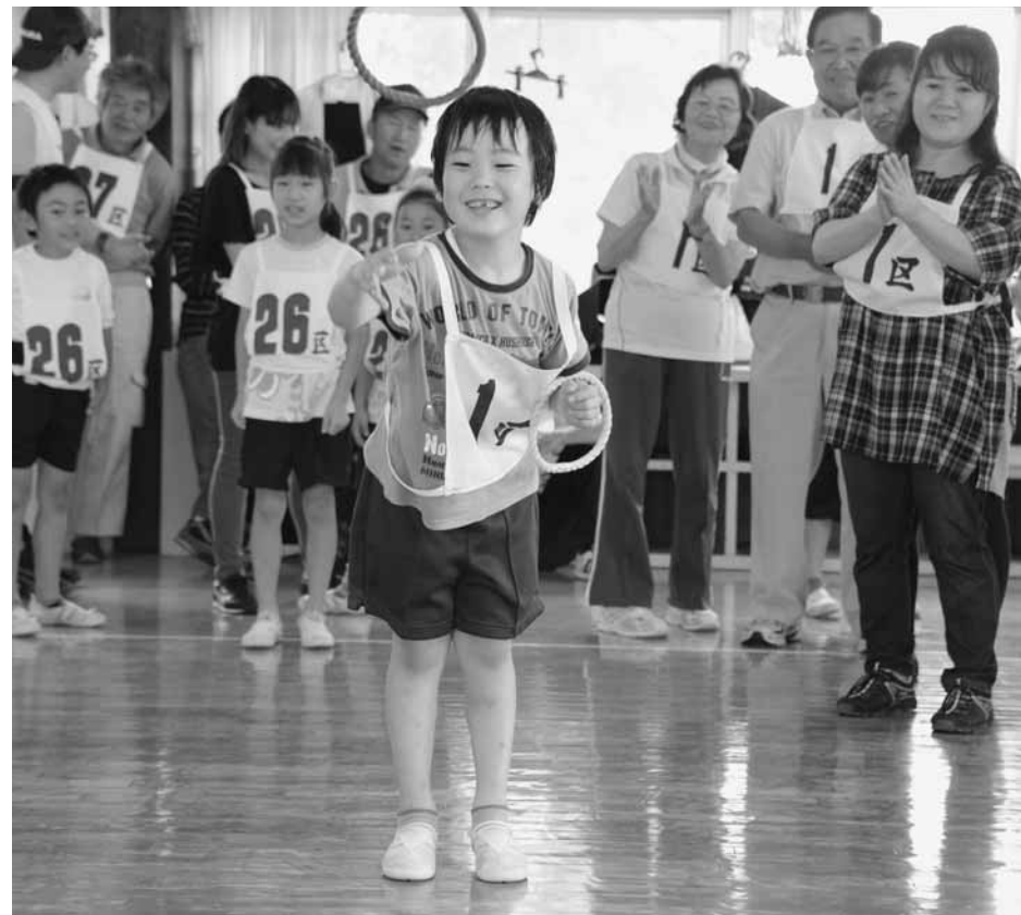
↓輪投げでのファインプレーには、同じ行政区の仲間から笑顔とともに拍手が送られました