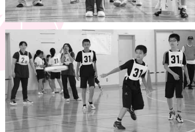
↑昨年度から取り入れられ、定着してきたディスクドッチ