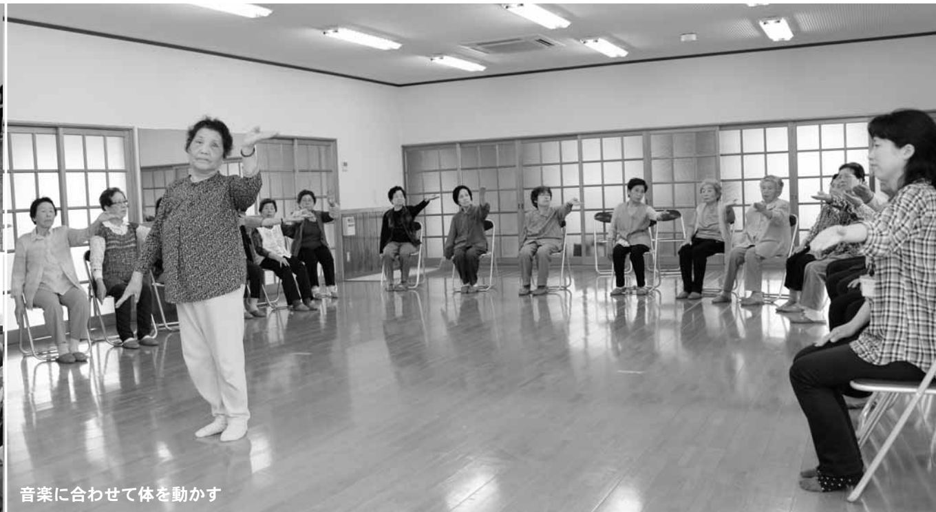
音楽に合わせて体を動かす