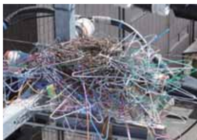
電柱上に針金ハンガーなどで作られたカラスの巣

カラスの繁殖時期を迎え、電柱上に作られるカラスの巣により停電事故の発生する恐れがあります。