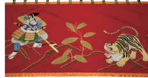
「ささら祭」で使用する「傘鉾の水引き幕 (加藤清正と虎)」

合わせてください。 ① 邑楽館林農業協同組合 本所2階 100人研修室 2月3日(水)～5日(金) 午前9時30分～午後4時30分 ② 役場 本庁舎2階 第1会議室 2月9日(火) 午前9時30分～午後4時30分 その他 使用する機械に変更があった等、手続きにご不明な点がありましたら、事前にお問い合わせください。 問合せ 太田行政県税事務所 ☎31-3261