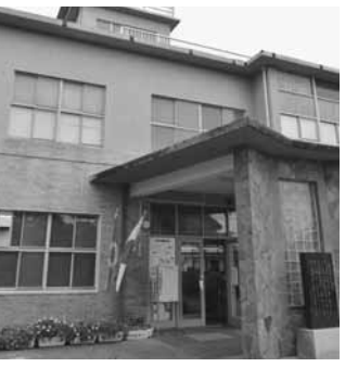
老朽化が懸念される現庁舎

町では、かねてより懸案であった現庁舎(昭和33年建築)の老朽化及び防災拠点・災害発生時対処機能の充実、緊急避難所の確保に向け検討してきました。これらは仮に合併した場合でも解決しなくてはならない問題です。