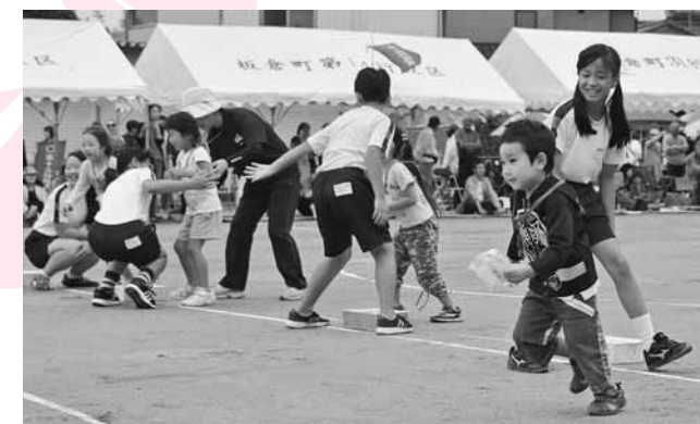
来年小学校に入学する園児も参加