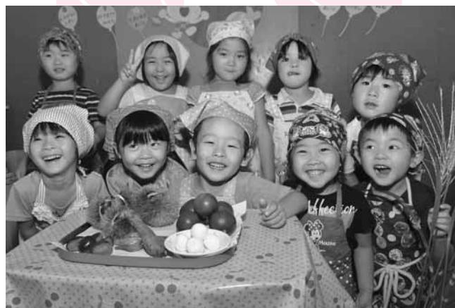
ススキや栗など季節のものを揃えてお月見気分

9月15日(木)、板倉保育園で、十五夜お団子作りが行われました。園児たちは、お団子の生地をちぎって「どれくらいの大きさにすればいいの? お月さまみたいにまん丸にするの?」などと先生に聞きながら、お団子をこころと丸めました。お団子はその日のおやつとして園児たちに振る舞われ、おいしく食べました。