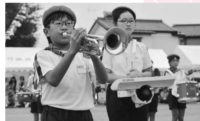
繰り返し練習した『聖者の行進』を披露