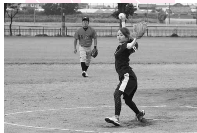
決勝戦を3点で抑える

決勝戦は北原ライオンズとミッキークラブで行われ、北原ライオンズが21-3でミッキークラブを下し、見事優勝を果たしました。