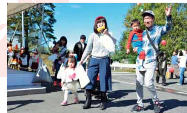
●商工祭では子どもたちがハロウィーンの衣装を楽しみました