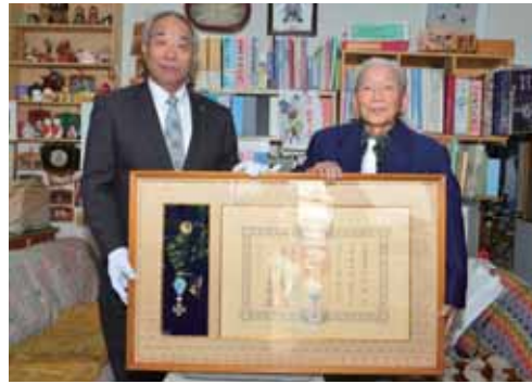
勲記は町長より伝達されました