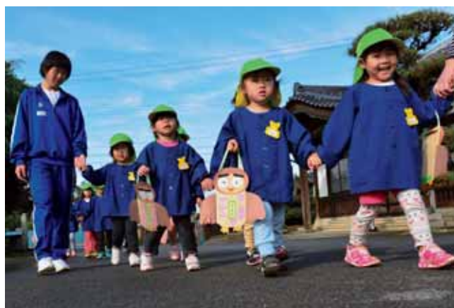
●七五三にちなんで近所の神社にお参りをしました

ソフトテニスまつり 11月12日(土)、ソフトテニスまつりが中央公園テニスコートで開催されました。この催しには、中学生から大人まで52人が参加し、ダブルスチームを組んで、ソフトテニスを楽しみました。なお、地元の食品会社がこの催しに協賛してカット野菜を提供しました。このカット野菜を使った焼きそばが、参加者に振る舞われました。