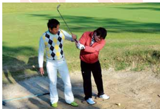
●バンカーでは上から振り下ろすように打ちます

10月27日(木)、太田市内のゴルフ場で、ゴルフラウンドデビューレッスンが行われました。この催しは、ゴルフのコースラウンド初心者が参加し、レッスンプロを講師に迎え、コース内でのマナーや基礎知識を学びました。参加したかたは、「ゴルフのコースに出るのは敷居が高いと感じていたが、この催しを通じてコースに出ることが出来たという経験になった」と話しました。