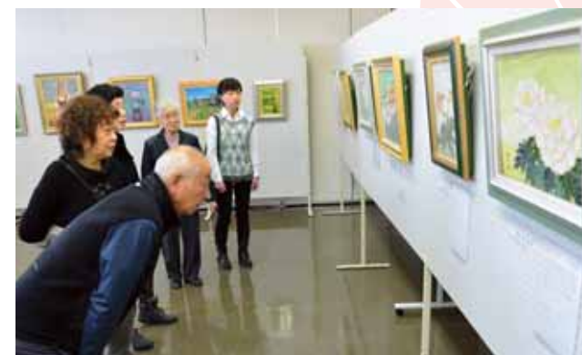
●種子工芸の作品を熱心に鑑賞する来場者