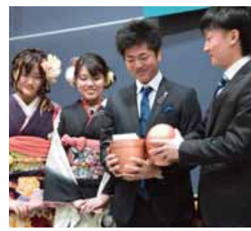
▲タイムカプセル開封式

期日 平成29年1月8日(日) 時間 午前9時15～45分 受付 午前10時 式典 午前10時 ※事前に送付した成人式開催案内のはがきを必ずお持ちください 会場 東洋大学板倉キャンパス 対象 平成28年4月2日～平成29年4月1日生まれの本町に住居登録をしているかた及び本町出身のかた