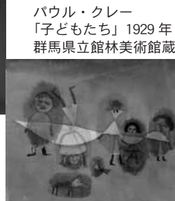
パウル・クレー 「子どもたち」1929年 群馬県立館林美術館蔵