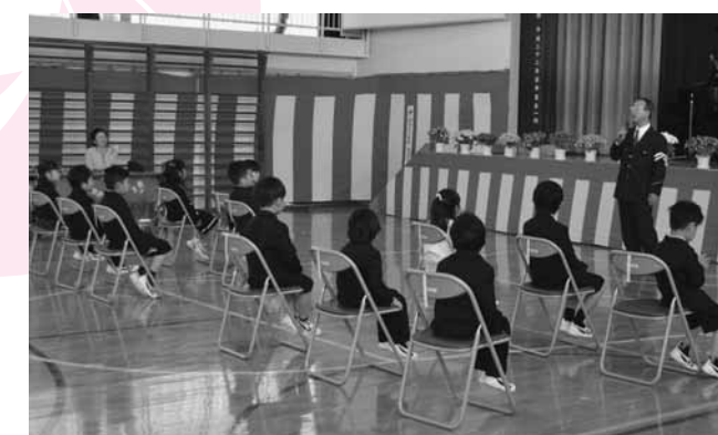
おまわりさんから、交通ルールを教えてくださいました