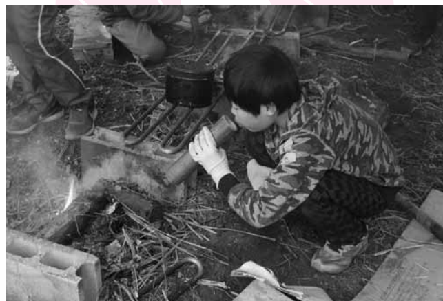
火が起かせないとご飯も食べられません

3月31日(土)、4月1日(日)の一泊二日で、サバイバルキャンプが行われました。今年は41人と大変多くの参加者が集まりました。このキャンプにはプログラムやスケジュールはありません。電気も水道もなく、テント張りも火起こしも、食事作りも自分たちの力だけで行います。大人は手を貸してはくれません。参加者達は仲間と協力しながらサバイバルを体験しました。