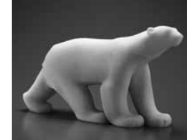
フランソワ・ボンボン 「シロクマ」1923-33年 群馬県立館林美術館蔵

テーマ 「アート遊覧紀行 ー自然と人間をめぐってー」 会期 6月24日(日)まで ※月曜日休館 時間 午前9時30分〜午後5時 (入館は4時30分まで) 会場 県立館林美術館(館林市日向町)