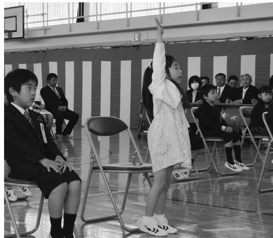
担任の先生から名前を呼ばれ、元気よく返事をする新1年生