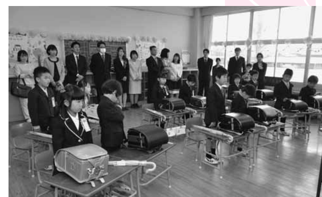
この教室で、新しい小学校生活が始まります