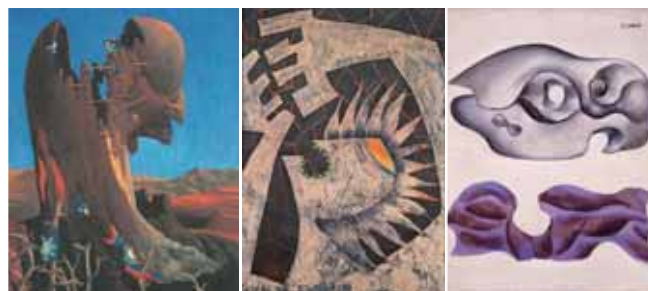
難波香久三（架空像） 芥川（間所）紗織 井上長三郎 《蒋介石よ何処へ行く》1939年 《女》1955年 《静物（骨と布）》1935年

館林美術館企画展示「時代に生き、時代を超える」板橋区立美術館コレクションの日本近代洋画1920s~1950s