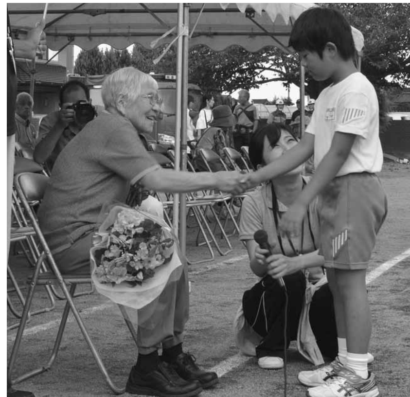
⑧ 南小学校での敬老の集い