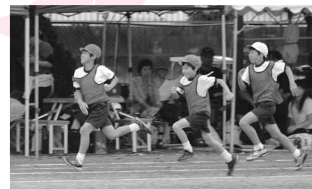
⑪ 北小学校の徒競走