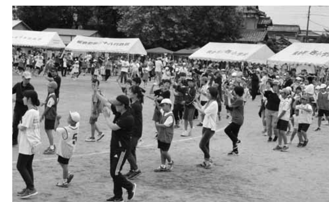
⑫ 西小学校の板倉音頭