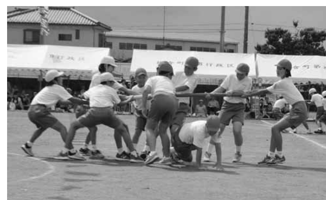
⑩ 南小学校の棒取り合戦