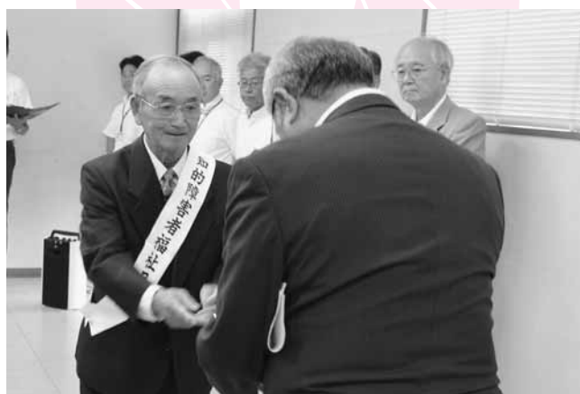
⑦ 板倉町療育父母の会から町長へメッセージを手渡す

第46回館林・邑楽地区福祉パレード 9月11日(火)、板倉町での式典をスタートに、館林・邑楽地区の福祉パレードが行われました。このパレードは9月の知的障害者福祉月間に合わせて毎年行われています。板倉町の式典では、約80名が参加し、板倉町療育父母の会から町に「住み慣れた地域で安心して暮らしていけるよう引き続き寄り添った支援をお願いします」とメッセージが伝えられ、共生社会の実現を訴えました。