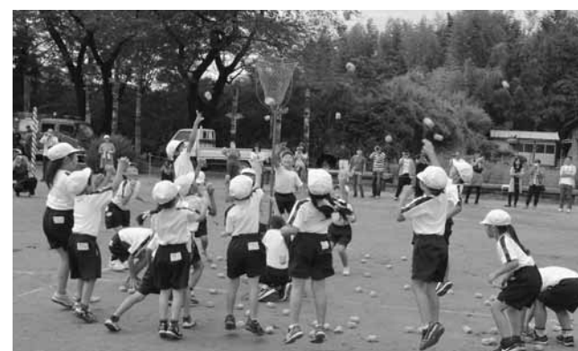
⑨ 東小学校の玉入れ

また、運動会にあわせて、敬老の集いも行われました。各小学校で6年生が歓迎のこたばを述べ、1年生が当日会場に来場された中で最高齢のかたに花束を贈りました。