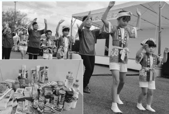
フードドライブで集まった皆さんの善意

10月20日(日)、板倉町総合老人福祉センターで第24回いたくら福祉まつりが開催されました。会場ではステージ発表や、各種団体の模擬店、バザーなどが行われ、多くの人出で賑わいました。なかでも、昨年から行われているフードドライブ(家で余っている食品を、フードバンクを通して困っているかたに分配する仕組み)では、多くの善意の品が集まりました。