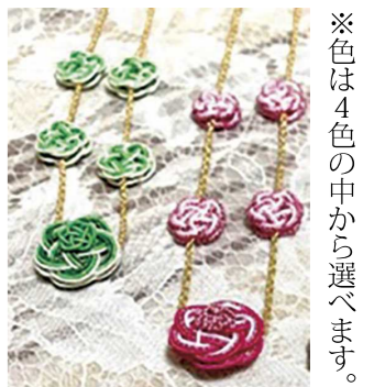
※色は4色の中から選べます。

北部公民館 将棋教室 期日 2月6日(土)・13日(土)・20日(土)・3月6日(土)・13日(土) 時間 午前10時30分 内容 将棋を通して世代間の交流をはかります。 受付期間 1月13日(水)～22日(金)