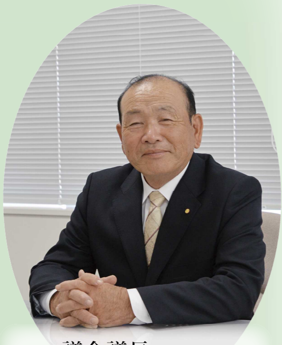
議会議長 延山宗一

例年、一定以上の額を納税していただいている事業主を対象に新年のご挨拶訪問をしておりましたが、昨今の新型コロナウイルス感染拡大状況に配慮し、訪問による対面での挨拶を自粛させていただきます。