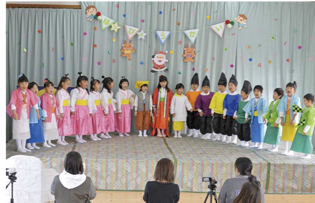
板倉保育園すみれ組のオペレッタ「かぐや姫」

園児たちは、練習してきた歌やお遊戯、楽器演奏、オペレッタなどそれぞれを上手に発表することができました。