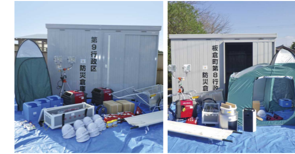
第9行政区の防災備品 第8行政区の防災備品

第8行政区・第9行政区では、(一財)自治総合センターの全国自治宝くじ交付金の受託事業収入などを財源とする「地域防災組織育成助成事業」を活用して、自主防災組織のための備品などを購入しました。 全国で販売される宝くじの収益の一部は、こうした地域の防災のためにも使われています。