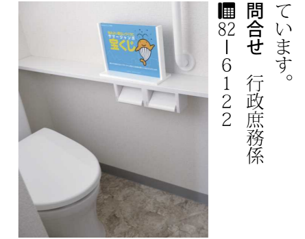
問合せ 行政庶務係 ☎82-6122

第4行政区では、(公財)群馬県市町村振興協会の市町村振興宝くじ交付金などを財源とする「魅力あるコミュニティ助成事業」を活用して、第4区岩田住民センターのトイレ改修を行いました。 全国で販売される宝くじの収益の一部は、こうした地域の健全な発展のために使われ