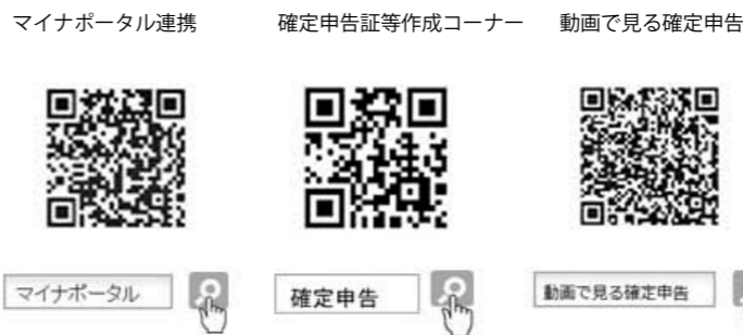
マイナポータル連携 確定申告証等作成コーナー 動画で見る確定申告