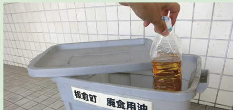
※ペットボトルなど、ふたの閉まる容器に入れてください

第1・3水曜日の開館時間にお持ち込みください 開館時間 午前8時30分～午後5時15分