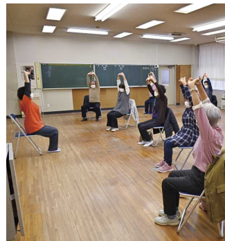
♥♥♥健康エンジンポイント♥♥♥

自粛生活が続く運動不足になっていませんか？一人では運動が続かない、運動の始め方がわからないかたはぜひご参加ください。