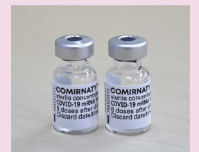
COMIRNATI (注射用mRNA COVID-19 mRNA) 1.0 dose vial (discard date)