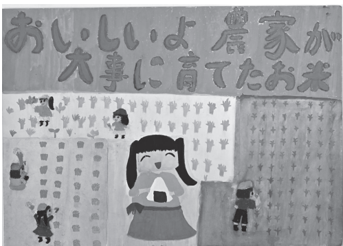
金賞 西小5年 蓮見真穂