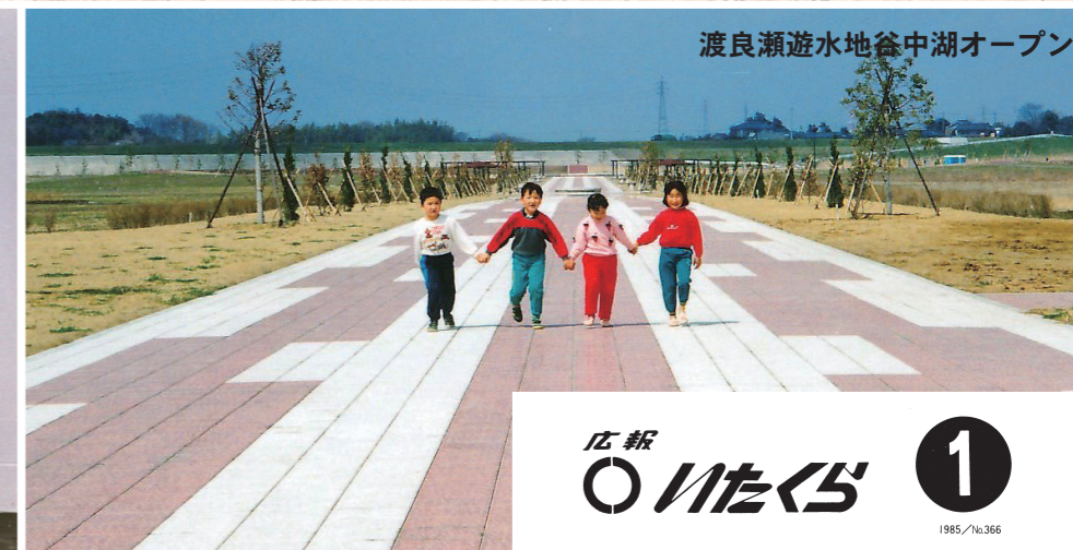
渡良瀬遊水地谷中湖オープン