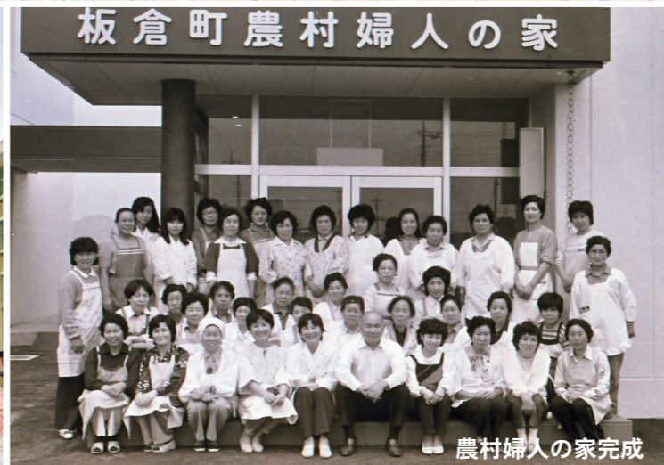
板倉町農村婦人の家