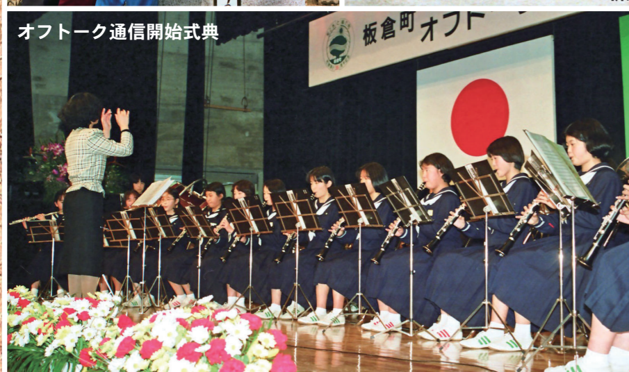
オフトーク通信開始式典