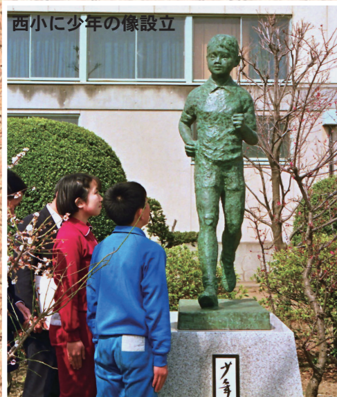
西小に少年の像設立