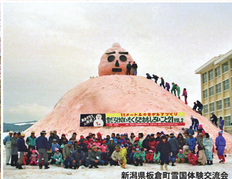
新潟県板倉町雪国体験交流会