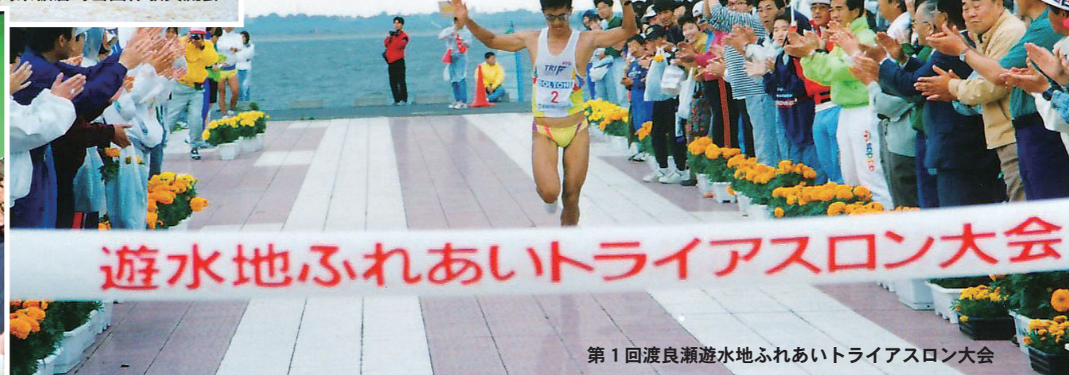
第1回渡良瀬遊水地ふれあいトライアスロン大会