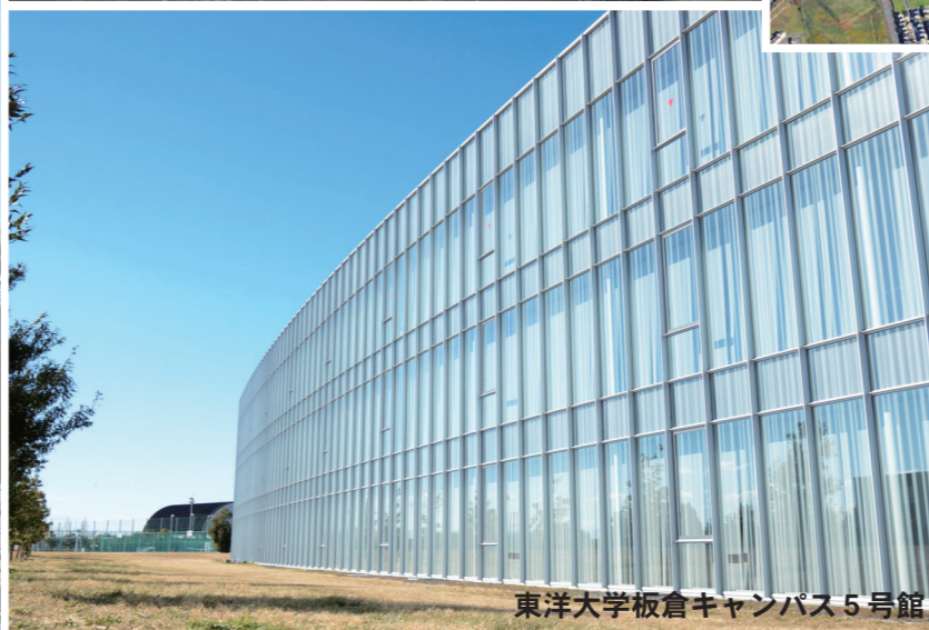
東洋大学板倉キャンパス5号館