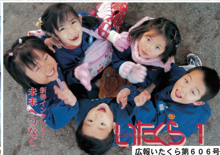
新海インタービュー 未来へつなぐ