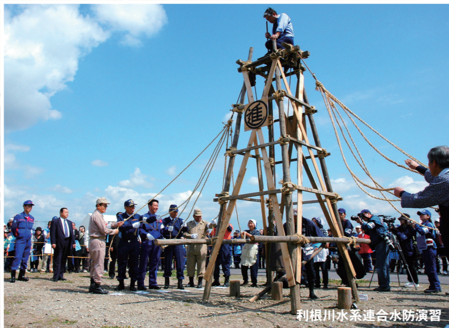
利根川水系連合水防演習