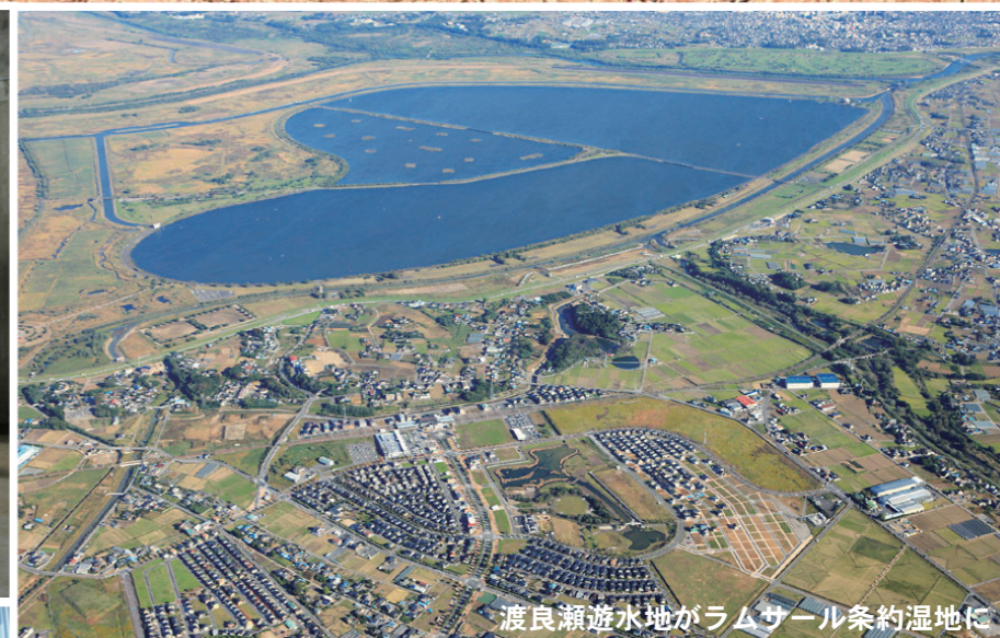
渡良瀬遊水地がラムサール条約湿地に