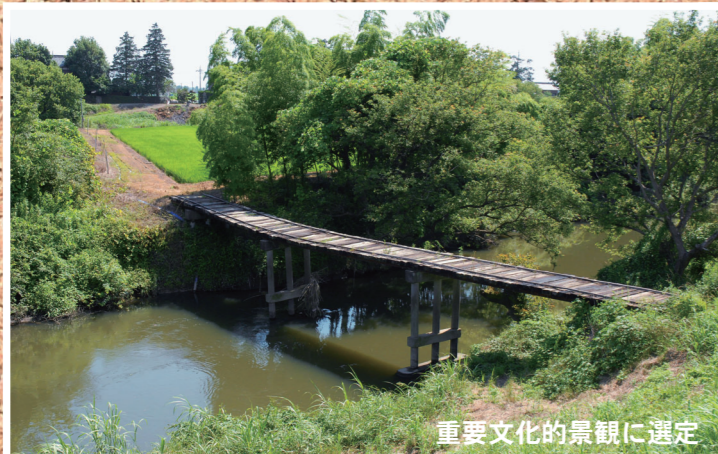
重要文化的景観に選定