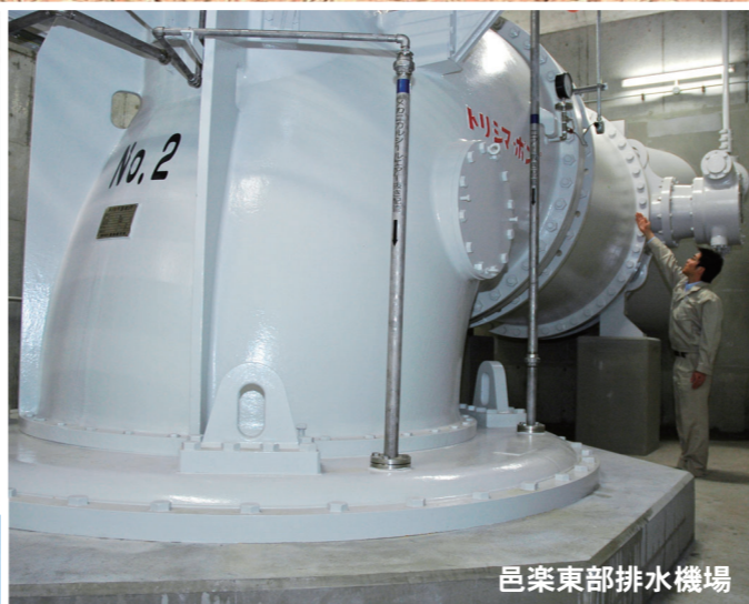
邑楽東部排水機場