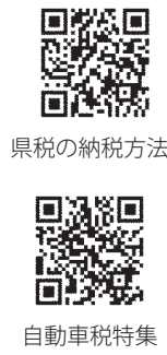
県税の納税方法 自動車税特集