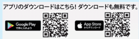
アプリのダウンロードはこちら!ダウンロードも無料です。

板倉町で は、子育て アプリ「いた くらまち子 育て応援ナ ビ」を導入し、 随時情報を 発信してい ます。 子育てに 役立つ情報・ 機能のほか、 流行疾患情 報(毎週更新)、休日当 番医、医療機関検索、 成人の健診日程、広報 いたくらなどもアプリ から確認することがで きます。登録料は無料 です。ぜひご利用くだ さい。