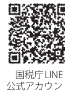
国税庁LINE公式アカウント