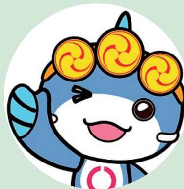
このアイコンが目印です