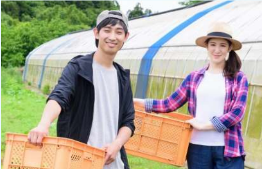
農業者の支援を通じ、農業振興を図ります