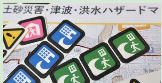
防災対策を通じ、安心できる暮らしを支える環境づくりを進めます