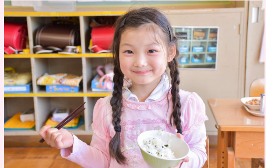
小中学校の給食費無料化を通じ、子育てしやすい環境づくりを進めます