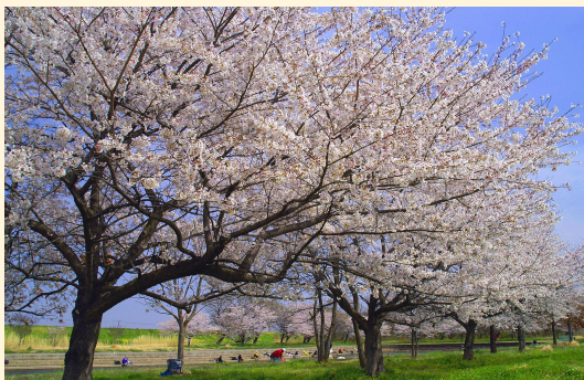
観光振興を通じ、交流人口・関係人口の拡大を図ります