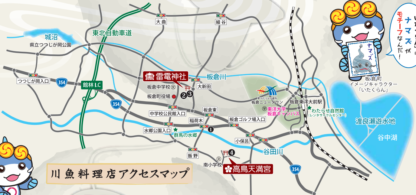
板倉町イメージキャラクター「いたくらん」