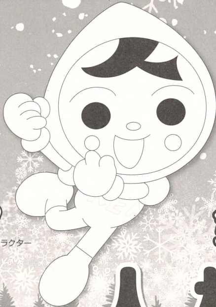
人権イメージキャラクター 人KENまわる君