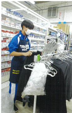
トライアル板倉店