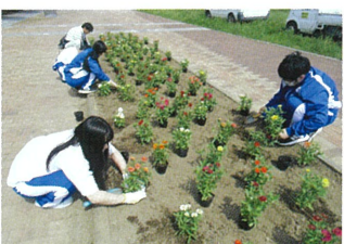
役場とのボランティア活動