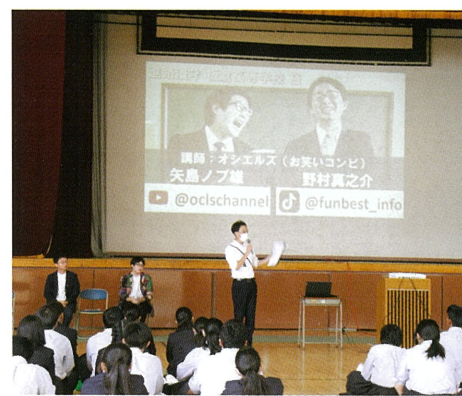
働くことについて

10月19日(木)1学年「進路ガイダンス」が開催されました。前半は漫才師「オシエルズ」を講師として「働くことについて」、後半は17分野について上級学校や企業の方に「個別ガイダンス」を開講していただきました。