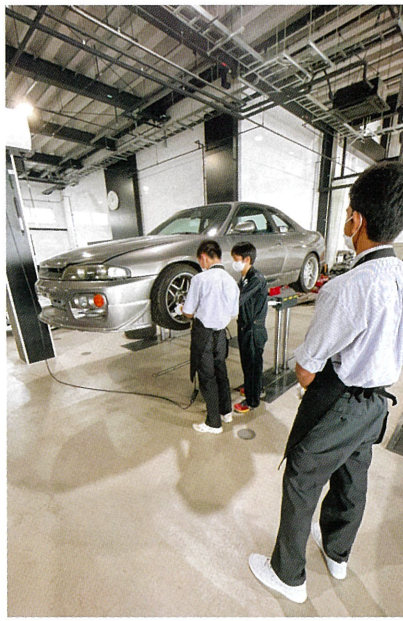
太田自動車大学校