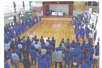
音楽集会(全校合唱)