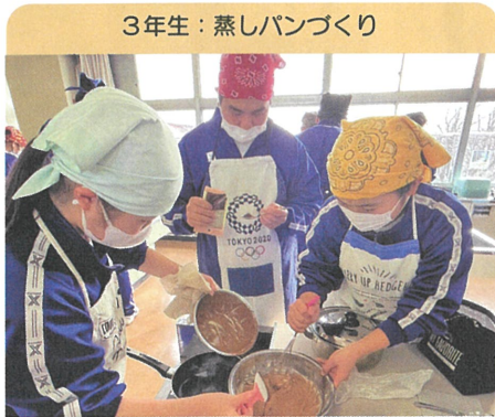
3年生：蒸しパンづくり

コロナ禍でなかなかできなかった調理実習が再開されました。3年生は「蒸しパン」、2年生は「おっきりこみ」の調理実習が行われました。この後、1年生は「豚肉の生姜焼きとポテトサラダ」の調理実習を行う予定です。