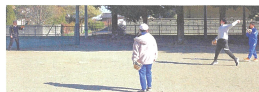
届いた大谷グローブで、校長先生と楽しくキャッチボール