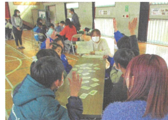
群大生による防災教育