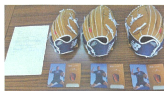
大谷選手から、グローブと、メッセージカード