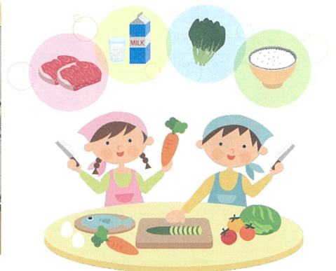
一生懸命な調理に完成が楽しみ