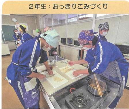
2年生：おっきりこみづくり