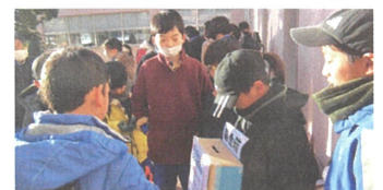
今こそ皆で支援を

1月25日(木)26日(金)の2日間、能登半島地震災害支援募金を児童会役員や福祉委員会の児童が中心となって実施しました。児童玄関で係児童が募金箱を持ち、登校する児童に募金を呼びかけ、多くの協力を得ることができました。総額119,905円が集まり、日本赤十字社を通じて被災地に送りました。ご協力、ありがとうございました。