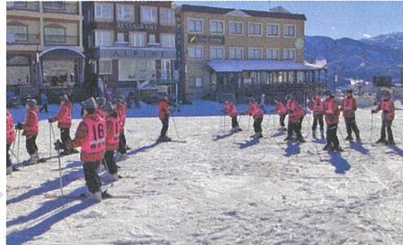
青空の下スキーレッスン