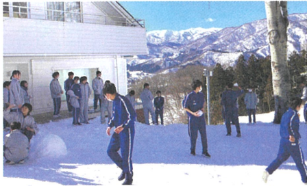
雪だるま作りと雪合戦♪

2年生は、1月30日から2月1日の2泊3日で、新潟県の岩原高原スキー場でスキー教室を行いました。県境の長いトンネルを越えると、バスの中から歓声があがりました。初日と2日目は天候に恵まれ、晴天の中グループごとのスキーレッスンを行いました。3日目のフリー滑走では、初めてのスキー体験であった生徒も大分上達して滑れるようになりました。「雪を溶かすくらい全力で楽しもう!」のスローガン通り、楽しい思い出ができました。