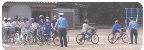
交通ルールを守り安全走行（3～6年生）