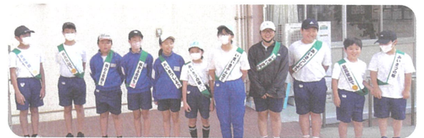
朝の始まりはまず、あいさつから

児童会役員や生活委員会の児童が中心となって、あいさつ運動を実施しています。児童玄関には、あいさつのスローガンが掲示されています。㊦：あかるいえがおで ㊧：いつでも、どこでも、だれとでも ㊨：さきにいきます ㊩：つづけます このスローガンが実践できることを願っています。