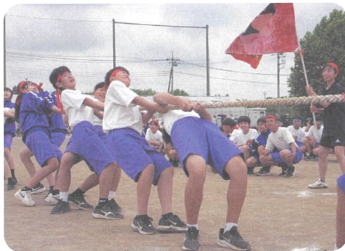
全力を出し切った綱引き対決