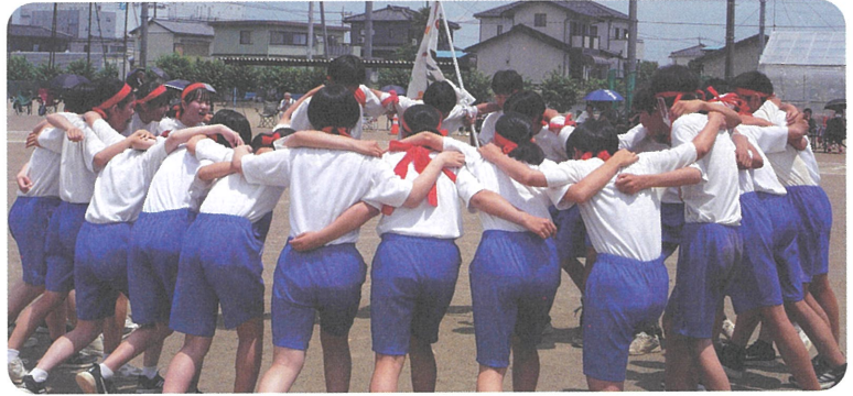
戦いに向けて皆で輪になり、絆を深めた団結