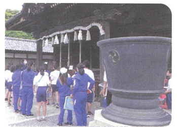
6年生：文化財めぐり