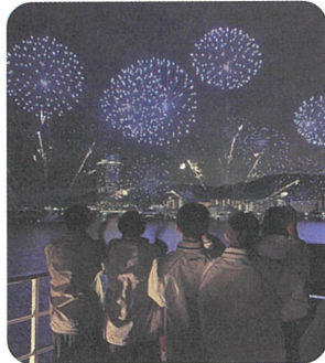
ディナークルーズで花火観賞