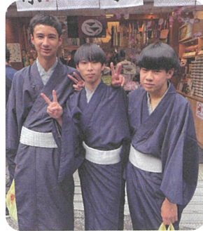
着付けをして京都を散策♪