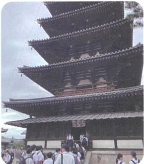
世界最古の木造建築法隆寺へ

1日目は、奈良の薬師寺・東大寺の他に、法隆寺まで足を延ばしました。夜は琵琶湖でディナークルーズを楽しみました。2日目はタクシーを活用し、班別行動を終日行いました。3日目は、京都市内を各クラス別の観光をしました。