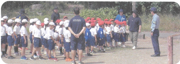
しっかり説明を受けました（1・2年生）

役場の安全安心係の職員や交通指導員、警察官の方々のご指導により、正しい歩行の仕方（1・2年生）や自転車の乗り方（3～6年生）について学びました。子どもたちは、交通ルールを守ることの大切さを感じていました。