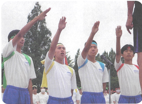
選手宣誓で、本気で取り組む姿勢を見せる

6月13日「声出し 笑って 全力で 今しかできない青春を」のスローガンのもと、今年度も学級対抗形式で体育祭を行い、学級の仲間との連帯感を高めました。