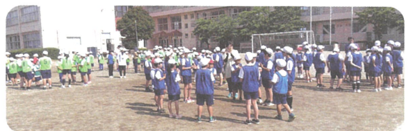
班ごとに自己紹介をして交流する様子

10月19日（土）に開催予定の運動会は、この4団で得点を競い合います。また、年に数回、団活動集会が予定されています。