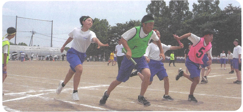
男女混合、盛り上がったリレー対決