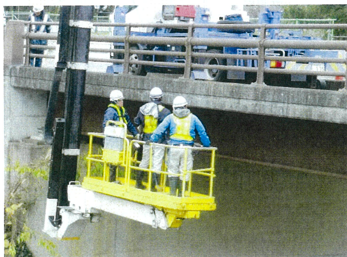
※点検作業時の様子