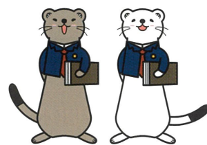
消費者被害防止啓発キャラクター「ジョー」と「オーコ」